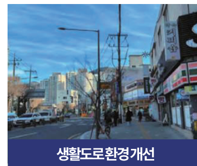
생활도로 환경 개선