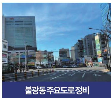
불광동 주요도로 정비