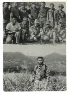
월남전투 4년 6개월 참전 (화랑무공훈장 2개 포함 8개 훈장수상)