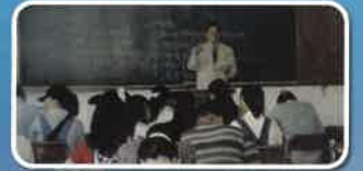
전주대 외래교수 (심리학, 행정학 7년 강의)