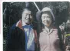
중학교 교사였던 가족과 함께