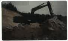
중앙초 외 7개 학교 운동장 적토