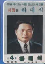
95년 시장선거 출마