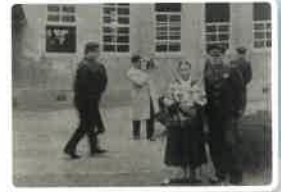
전주고시절 가정교사 학부모