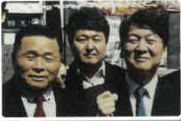
국민의당 지역 위원장 (임실, 순창, 남원)

3선도의원, 농협이사, 29년 공무원 경험과 중앙 인맥을 최대한 활용 남원시장을 도와 남원 발전을 위해 최선을 다하겠습니다.