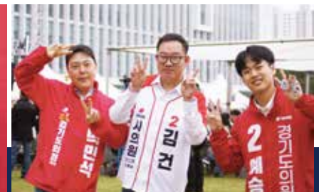
청년이 앞장서서 더 밝은 부천의 미래를 만들겠습니다.