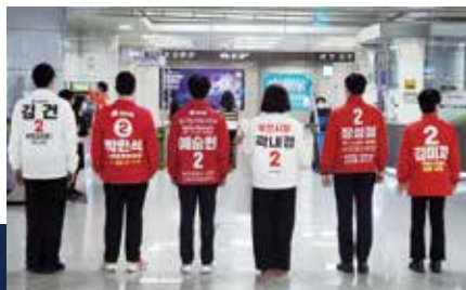
원팀으로 '더 나은 부천'을 만들겠습니다.