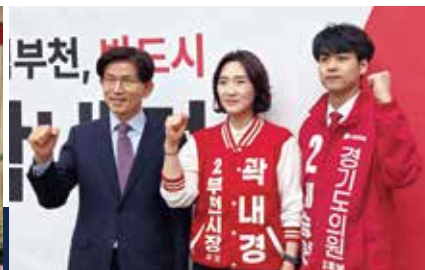
김문수 전 장관, 박내경 부천시장 후보와 함께 승리하겠습니다.