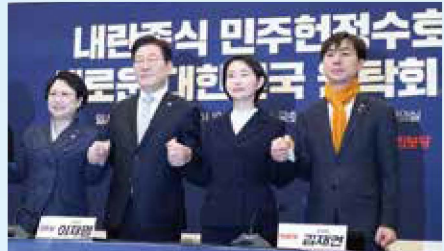
*내란중식 민주헌정수호 새로운 대한민국 원탁회의 출범식(25.2.19) 윤석열 탄핵 심판에 따른 조기 대선에서 국민의힘 재집권 저지를 위해 당시 5개 원내야당이 공동으로 출범