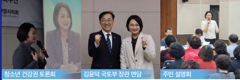
청소년 건강권 토론회