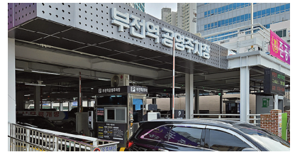
부전역 공영주차장 증축