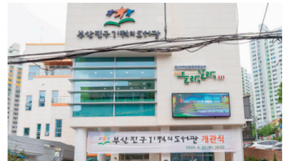
기적의 도서관 건립