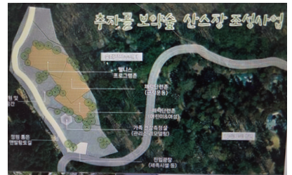
추자골 산스장 조성사업 조감도