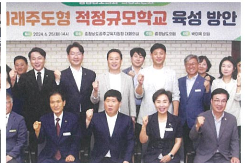
▲ 미래주도형 적정규모학교 육성 연구모임