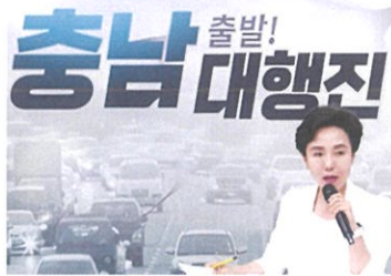
▲ 충남방송 헬로이슈토크 헬로TV뉴스