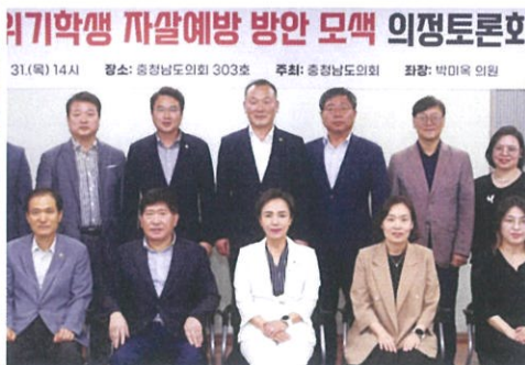
▲ 심리적 위기학생 자살예방 방안모색 의정토론회