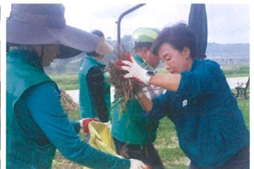
▲ 폭우로 인한 침수 피해 현장