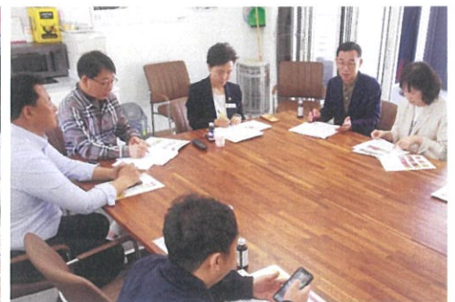
▲ 대화과 소통을 통한 의정활동