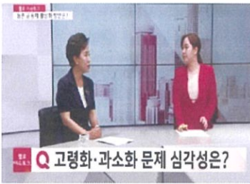
▲ TBN 충남교통방송 라디오 힘센인터뷰