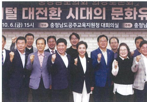
▲ 충남디지털문화유산 교육 활성화 연구모임