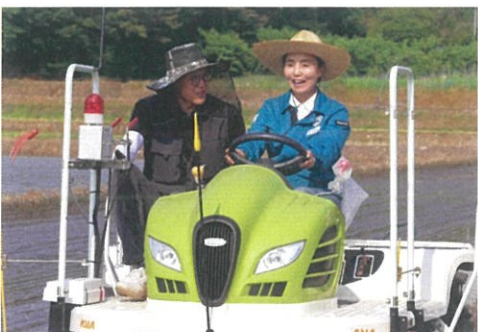
▲ 벼 재배단지 현장