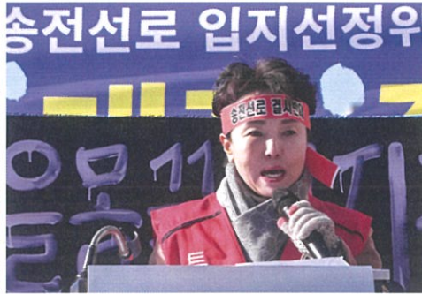
▲ 송전선로 결사반대 집회