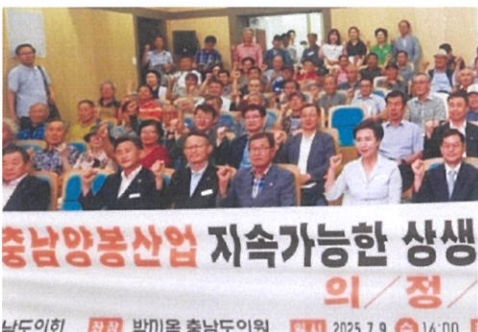
▲ 위기의 충남양봉산업 지속가능한 의정토론회