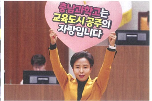
▲ 충남과학고 이전 결사반대