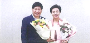
▲ 충청남도의회 의정대상 수상