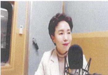
▲ KBS1 라디오 5시 대·세·남!