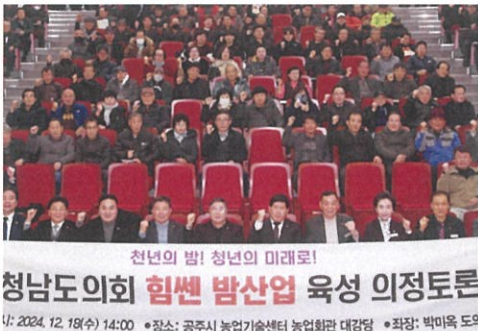
▲ 충남 힘센 밤산업 육성 의정토론회