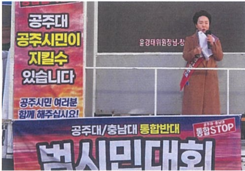
▲ 공주대·충남대 졸속 통합반대 범시민대회