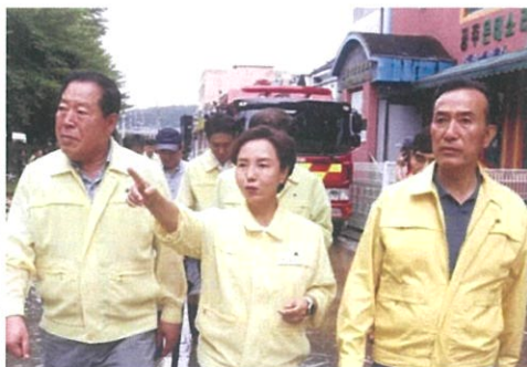
▲ 현장에서 답을 찾는 발로뛰는 의정활동