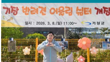
2026년 3월 8일 개장한 1969㎡ 규모의 반려견 전용 공원 추진 완료, 정관 지역 놀이터 추진 중