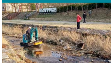
자연친화적 산책로 및 좌광천 수질 개선 현장 점검 국가정원 추진에 따른 기반 구축 추진 중