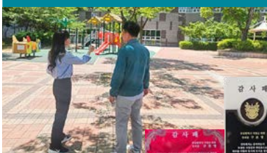
동원 1차·2차 주민들로부터 감사패 수여