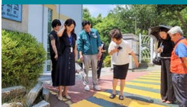
우천시 학생들의 안전 확보 2025년 7월 완공