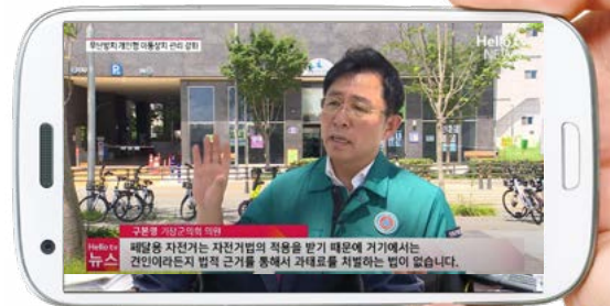
헬로N뉴스 지자체도 손 못대는 '공유 자전거' “지자체가 조례를 통해 관리할 수 있도록 법개정이 시급하다”

단순한 민원 전달에 그치지 않고 “어떻게 예산을 확보할 것인가? 어떻게 사업을 현실화할 것인가?”를 기획하고 추진해 온 실행형 일꾼입니다.