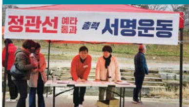
2026년 2월 12일 기획예산처 재정사업평가위원회 예비타당성조사(예타) 최종 통과에 총력 다함