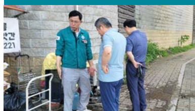
2025년 8월 20일 정관 동일스위트 2차 웅벽 하부 누수 보수공사 추진 완료