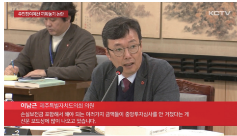
KCTV (예결위) 예산결산 첫 날...주민참여 예산 끼워넣기 '논란'