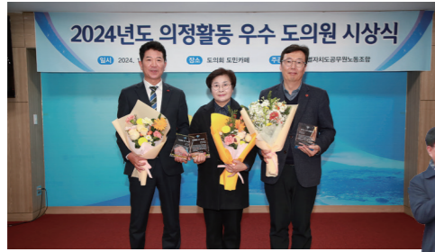
제주특별자치도공무원이 뽑은 의정활동 우수 도의원 (2024, 2025 2년 연속)