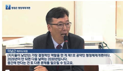
KBS 제주 (행정사무감사) 마지막 행정사무 감사 시작... '행정체제개편' 쟁점