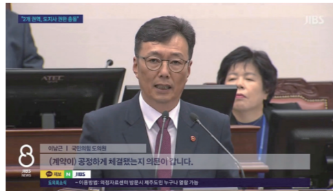
JIBS (도정질문) 기초단체 논의 미뒀지만, 2개 단체엔 '부정적'