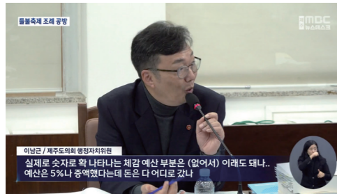
제주 MBC (뉴스데스크) 들불축제 조례 공방