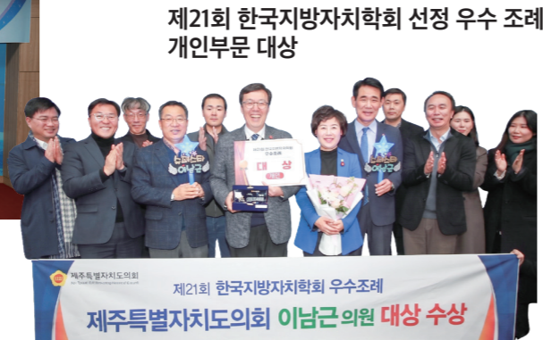
제21회 한국지방자치학회 선정 우수 조례 개인부문 대상