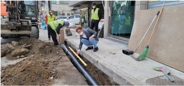
물이 고여 불편한 연립주택 앞 집수반이 설치