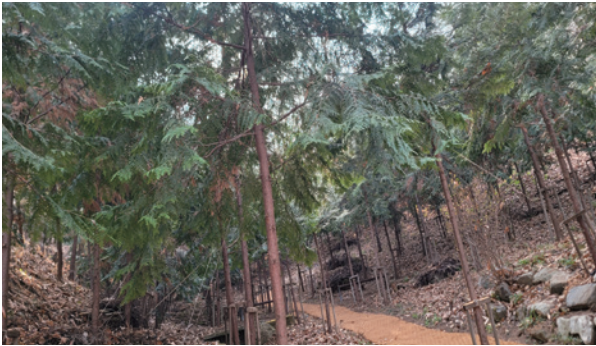
소사대공원 위쪽에 있는 편백나무 숲

소사대공원 인근 사계절 푸른 편백나무 숲, 어린이는 물론 시민들의 쾌적한 휴식공간을 만들었습니다.