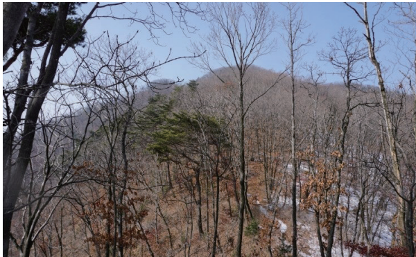
숲 기능이 저하된 겨울 숲