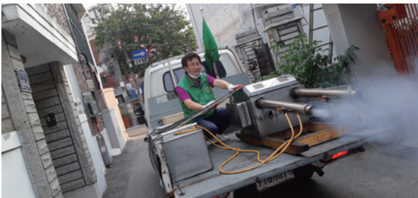
모기,파리 등 해충 방제 활동