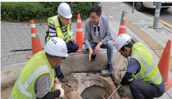
하수 분류관이란? 정화조를 없애고 별도의 오수관을 만드는 것으로 하수구 악취도 감소합니다. 신도시 하수개념입니다.