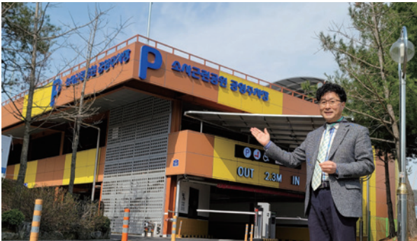
소새울역 한울빛도서관 공영주차장 (소사국민체육센터 주차난 대비)