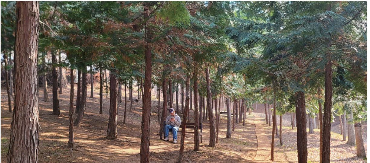
[김주삼이 시작한 성주산 편백나무 숲]