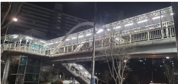
소새울 육교 리모델링