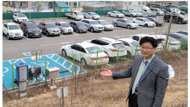
부원초등학교 후문 앞 공영주차장

소사대공원 인근 사계절 푸른 편백나무 숲, 어린이는 물론 시민들의 쾌적한 휴식공간을 만들었습니다.