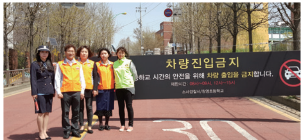
초등학교 앞 통학로 안전 차단장치 설치