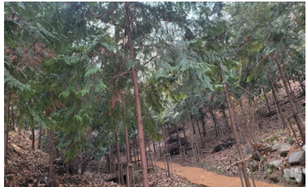
겨울에도 푸른 숲세권 부분 조성(편백나무, 잣나무 등)