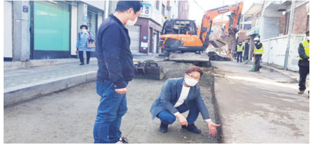
부실공사 제보에 따라 현장 점검,개선