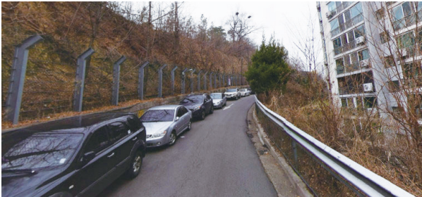
성지아파트 뒤 낮은 난간, 보행로 없는 위험한 산책로 - 안전난간 재설치 및 보행로를 신설 했습니다.