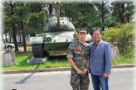
장남 2017 해병대 포항 1사단