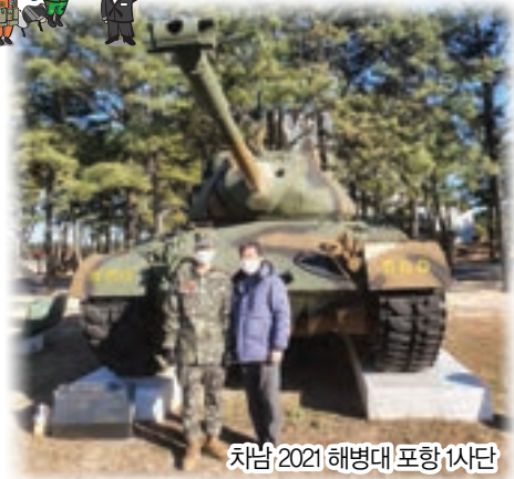
차남 2021 해병대 포항 1사단