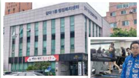
헬스장, 남녀 샤워장 조성