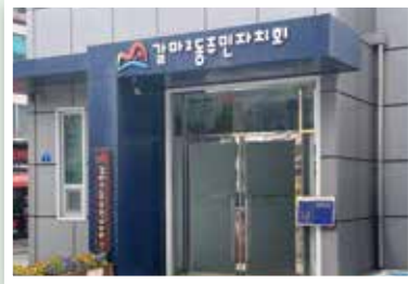
갈마2동 주민자치회 사무실, 회의실