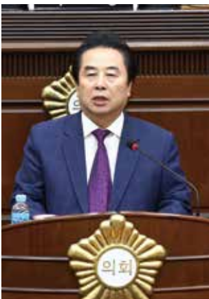
갈마2동 박범계국회의원과 빵봉사

한마음 음악축제, 갈마을 목신제 등 지역의 전통문화 행사와 각종 행사를 주관하며 지역민의 화합과 결속을 도모하는 한편 서구를 사랑하는 많은 지역인사들을 찾아다니며 지역발전을 위해 노력해 왔습니다.