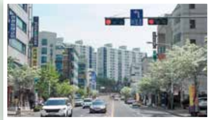
전선지중화, 이팝나무 심기, 인도블럭 공사