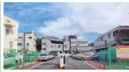
갈마동 제5공영주차장 조성