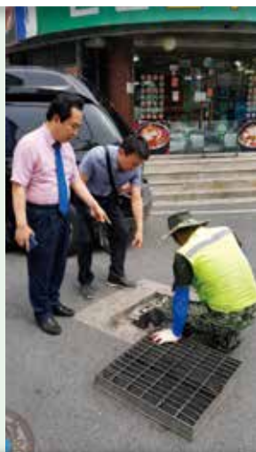
용문동 하수구 악취방지 덮개 공사현장