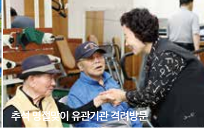
추석 명절맞이 유관기관 격려방문