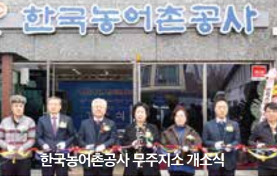
한국농어촌공사 무주지소 개소식