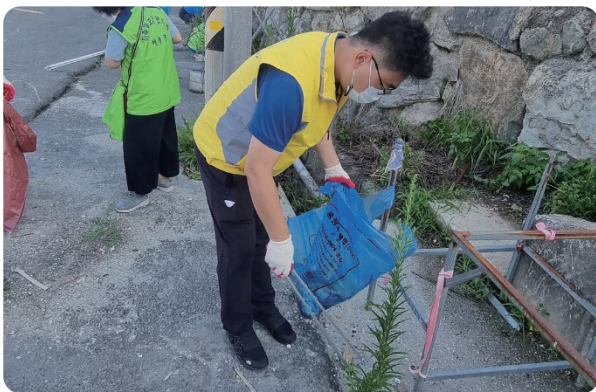
“신대지구 구석구석 환경 정화 활동”