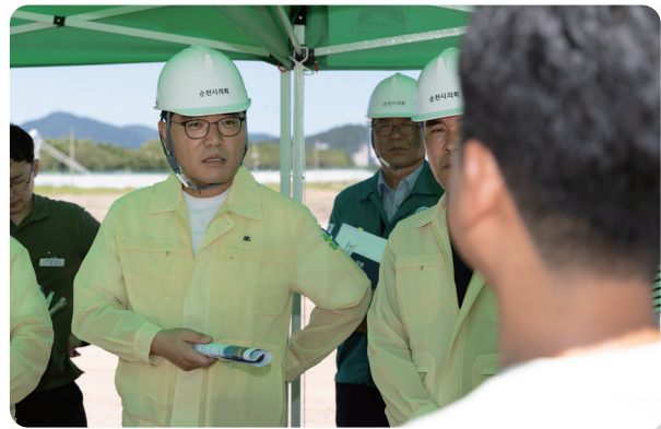
“신대지구 주요 공사 현장 안전 점검”