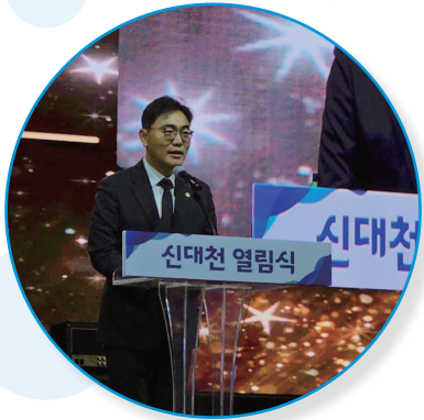
“주민 품으로 돌아온 신대천”