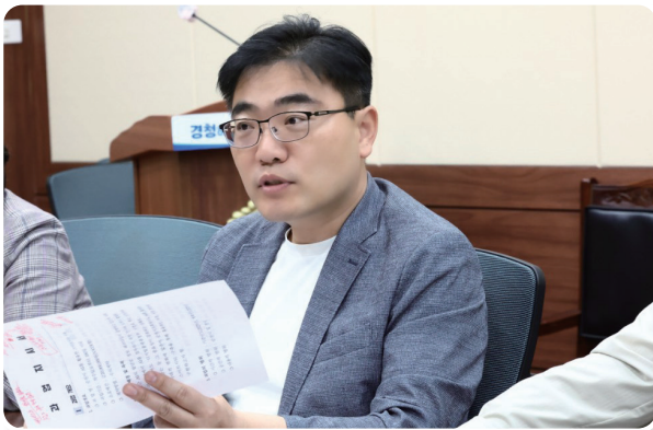
“신대의 권리를 지키는 간간한 일꾼”