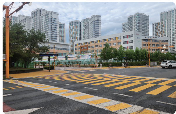
“아이 먼저! 발로 뛰어 만든 옐로존”