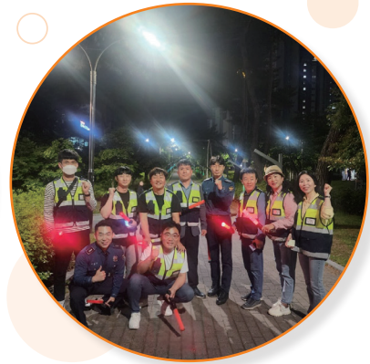
“신대지구 안심 귀가 야간 합동 순찰”