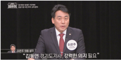
“김동연 경기도지사, 강력한 의지 필요”