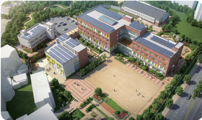
인창초 105주년, 새로운 탄생(약 300억원)