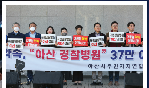
아산경찰병원 유치 운동