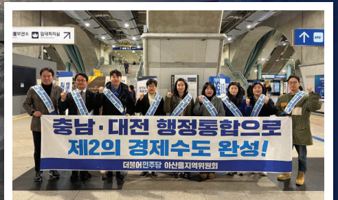
충남·대전 행정통합 촉구 운동