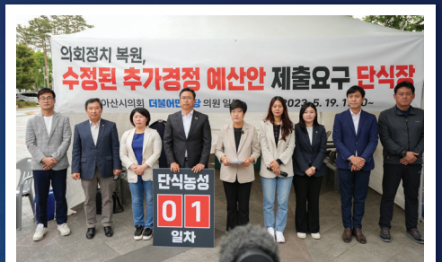
교육 예산 원상회복 요구하며 5일째 단식