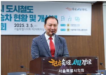
▲ 토론회 개최