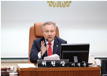
▲ 서울교통공사 사장 인사청문회