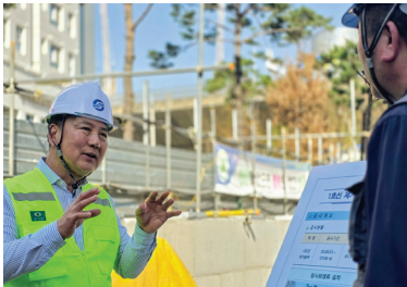
▲ 제기동역 에스컬레이터 설치