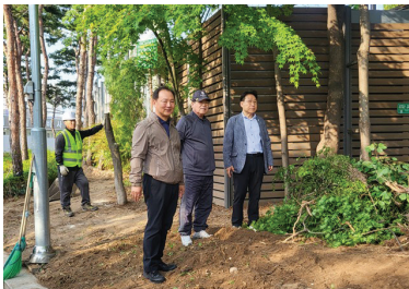
▲ 홍릉근린공원 맨발산책로 조성