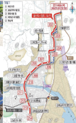
수소트램2호선 진장유통단지 경유 확정