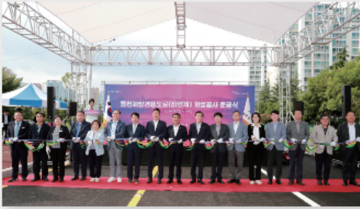
동천제방경용도로(좌안제)개설 사업비 113 억원