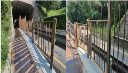
명촌지하차도 보도개선공사 사업비 7천 5 백만원