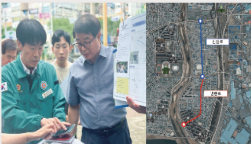
2024년 진장명촌지구 노후도로 정비사업 사업비 10억 4 천만원