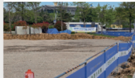
효문동행정복지센터 주차장 공사비 확보 3 억원