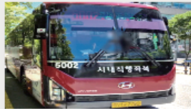
5002번 리무진버스, 신선도원몰 앞 정차