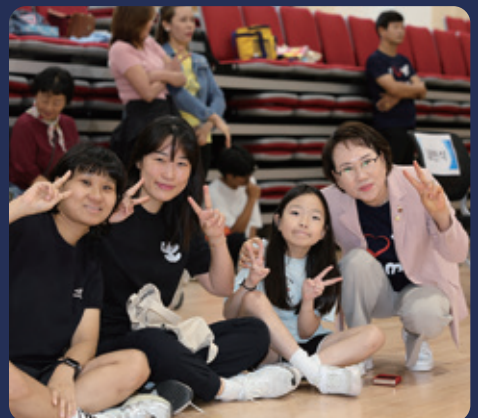
2024 가족 어울림 한마당