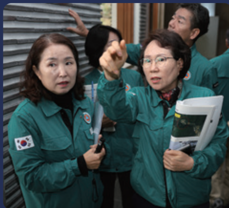
예천 서약사 석가모니후불탱 공영간 보수