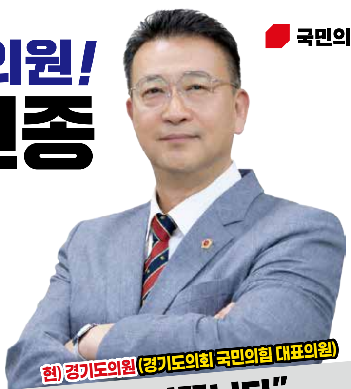
현) 경기도의원 (경기도의회 국민의힘 대표의원)