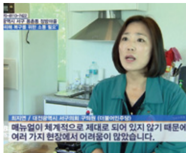
피해구제 대책 호소 방송인터뷰