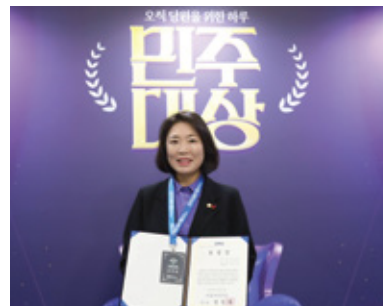
지원근거 조례제정으로 수상