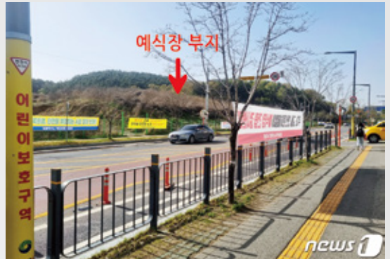
당시 도솔초 앞 (도안동) 주민들이 게시한 예식장 건립반대 현수막 현장사진