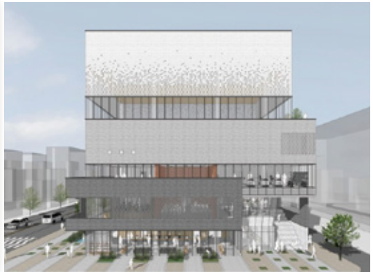
관저 복합문화센터 (가상이미지)