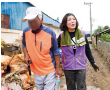
수해복구 재난현장 자원봉사