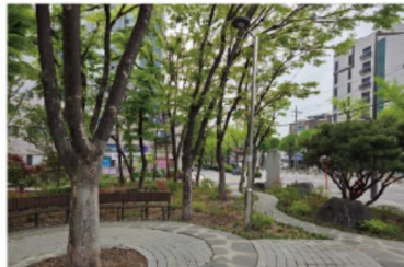
전농2동 마을마당 정비