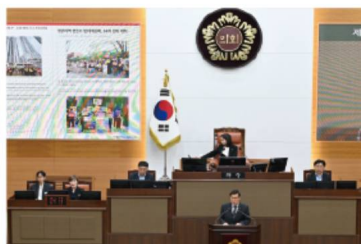
GTX 청량리역 변전소 이전 축구 5분 자유발언