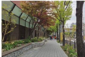
전곡초 자녀안심 그린숲