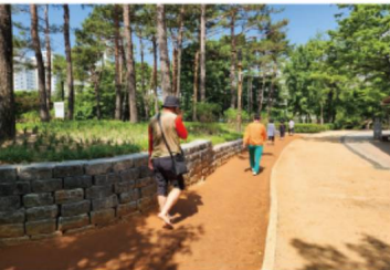
간데메공원 맨발 황톳길