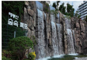
배봉산 숲속 폭포