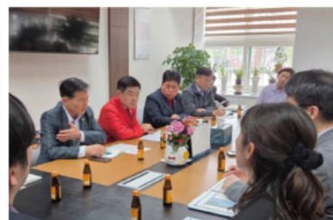
전곡초 수영장 운영 동대문구 이관 협의