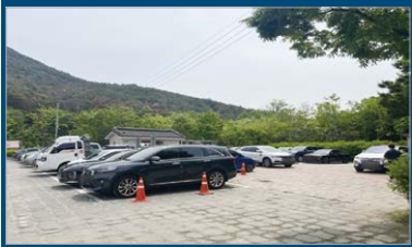
위양지 주차장 건설