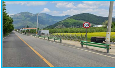
산내면행정복지센터~ 얼음골APC 인도설치