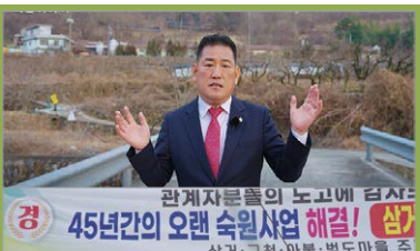
“45년만의 쾌거” 삼거마을 돼지돈사 철거확정