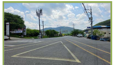
금곡교 ~ 창마터널 3차선 확보