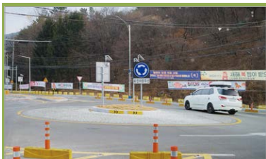
금곡교 인도 및 회전교차로 설치