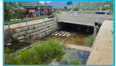
임고 교차로 배수로 확장공사