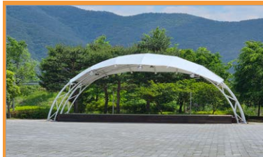
산외문화센터 야외공연장 무대설치