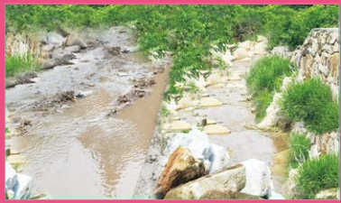
도곡 소하천 정비공사 고정지구 하수도 설치공사