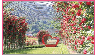
명품 장미길 조성 및 데크설치