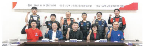
라이더 배달종사자 지원

강북구에서 오토바이 배달업에 종사하는 인원은 5000명 정도입니다. 유인애 의원은 배달종사자의 고용보험료 예산을 증액하고 안전사고 예방을 위한 지원을 추진하여 배달종사의 노동환경 개선을 위해 노력했습니다.