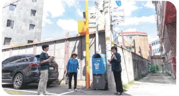
주민 안전 확보위해 수유2동 CCTV 설치