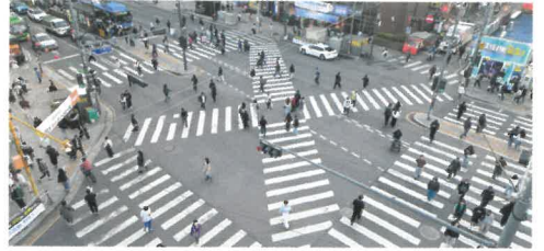
수유역 대각선횡단보도 설치 완료