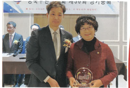
강북구한 의사회 감사패