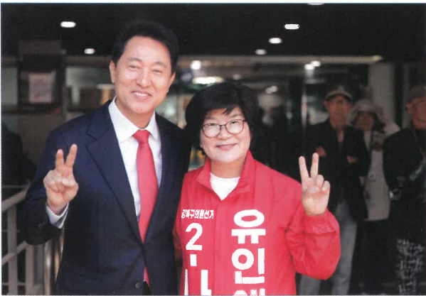
오세훈 서울시장과 함께