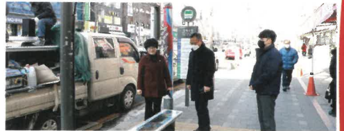
버스정류장 온열의자 설치