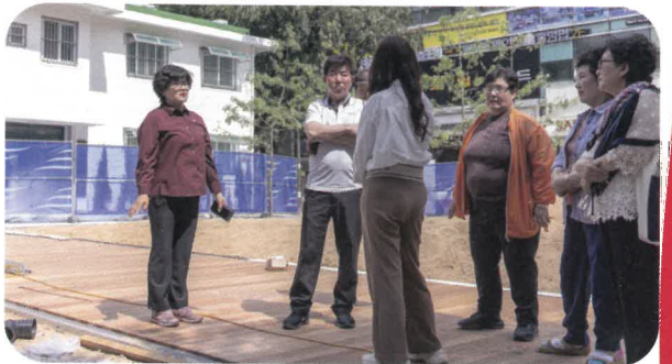
상산어린이 공원 환경개선 공사 현장