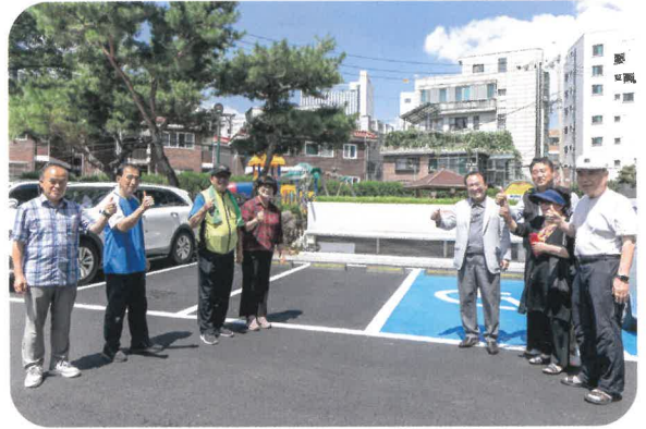
변동삼성·변동쌍용 공동주택 지원사업 완료