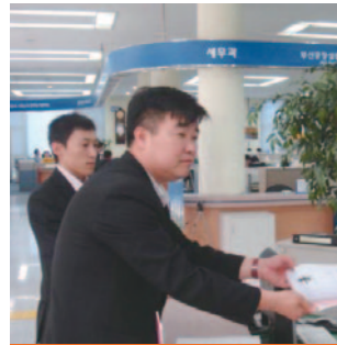
안평~기장선 유치 주민서명지 접수