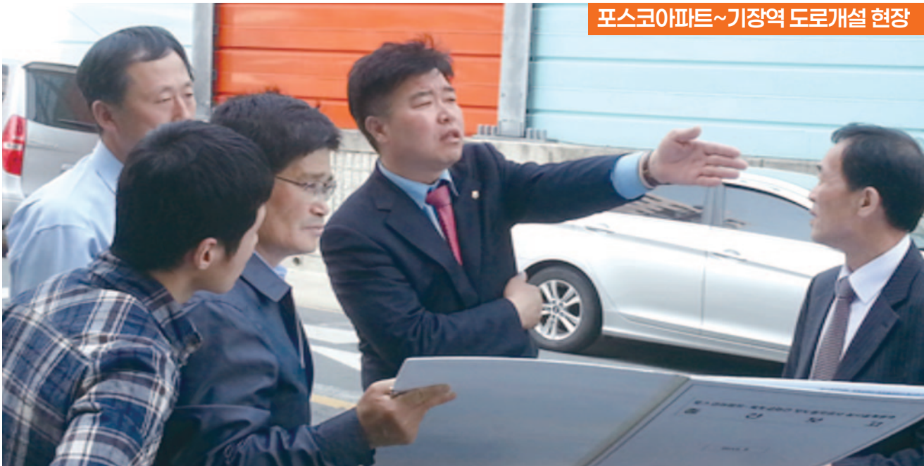
포스코아파트~기장역 도로개설 현장

풍부한 분석력, 탁월한 추진력을 바탕으로 우리 기장의 숙원사업 해결을 위해 머슴처럼 일하겠습니다!