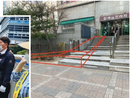
〈유모차와 노약자 보행로 개선〉