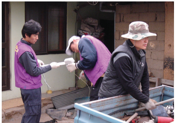
▲ 집수리 봉사활동