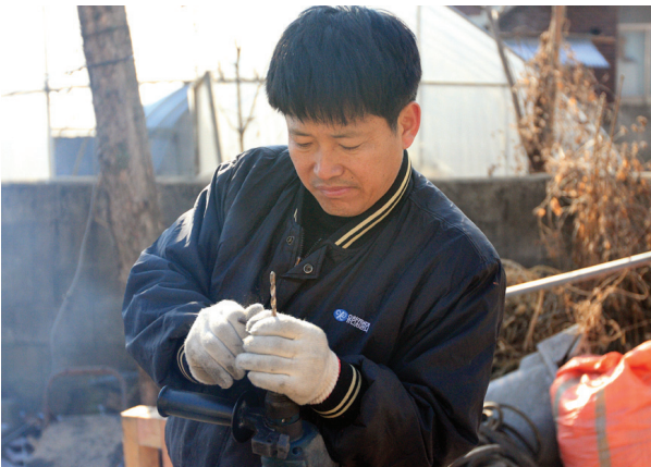
▲ 집수리 봉사활동