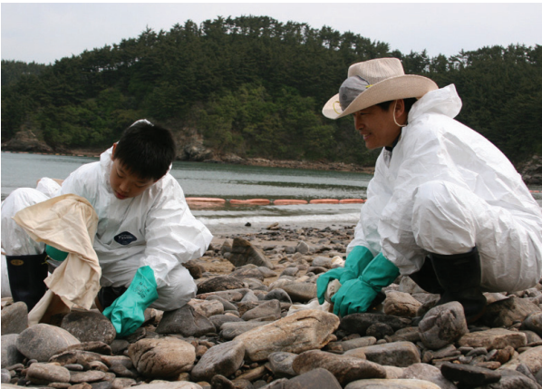
▲ 태안 기름유출사고 복구 봉사현장