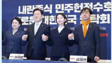
*내란종 민주헌정수호 새로운 대한민국 원탁회의 출범식(25.2.19) 윤석열 탄핵 심판에 따른 조기 대선에서 국민의힘 재집권 저지를 위해 당시 5개 원내야당이 공동으로 출범