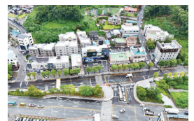
▲ 민속촌인구삼거리 가감속차선 정비 공사5억원