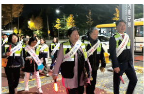
▲ 기흥구 청소년 유해환경합동지도단속