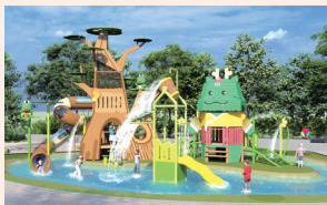
보라동 색동저고리공원 어린이 물놀이장 준공(2025)