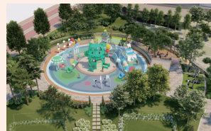
상하동 지석1 어린이공원 물놀이장 조성 (2026 준공예정)