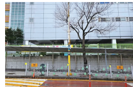
▲ 보라동 나산초 통학로개선차양 설치