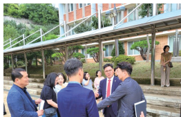
▲상하중학교 '교육환경 개선' 방문