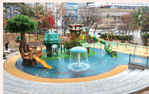
동백2동 늘찬근린공원 어린이 물놀이장 준공(2025)