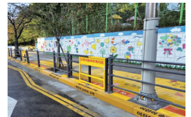
▲ 동백 초당초 안전한 통학로 조성