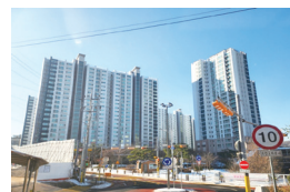
▲ 지석초 앞 회전교차로 설치