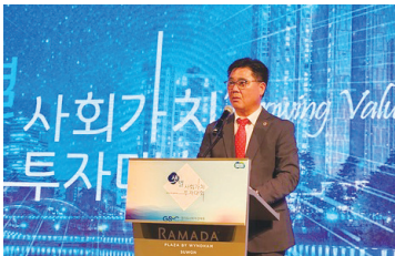
▲ 사회적경제기업이 사회적가치 창출