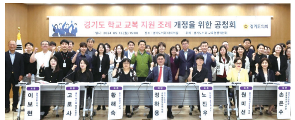
▲ 「학교 교복 지원 조례」개정을 위한 공청회 개최