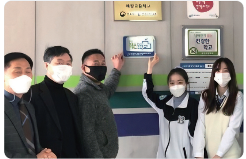
배방고등학교 [혁신학교] 현판식