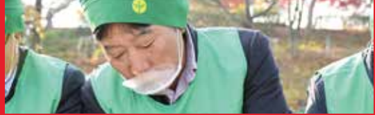
2025년 12월 고령군의회 증무식 참석