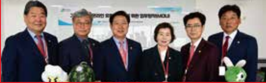
2025년 5월 관음사 봉축행사 참여 및 주민소통