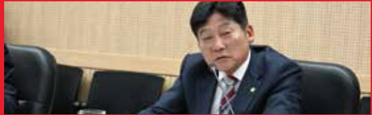
2026년 3월 대구경북 행정통합 특별법 조속 처리 촉구