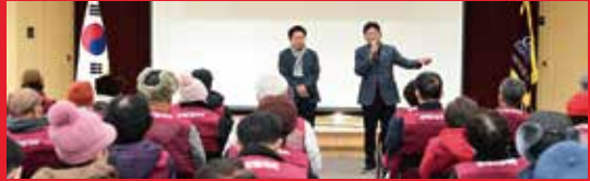
2026년 2월 제305차 의원회의 참석 및 지역 현안 논의