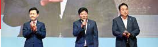
2025년 10월 낙동7경 문화한마당 참석