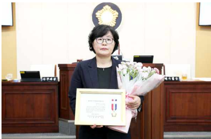
2024년 지방의정봉사상 수상(전국시군자치구의회의회장협의회)

선거사무소: 충청남도 태안군 소원면 서해로 669번지 전화: 010 8806 8773