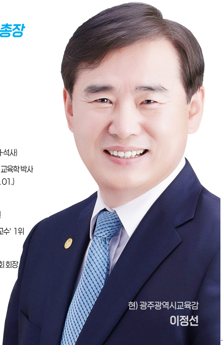
현) 광주광역시교육감 이정선