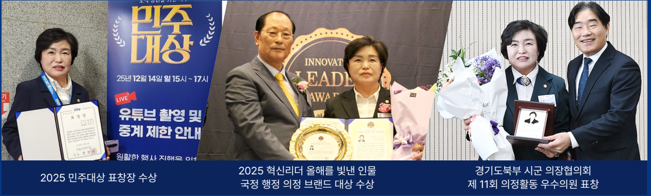
2025 민주대상 표창장 수상