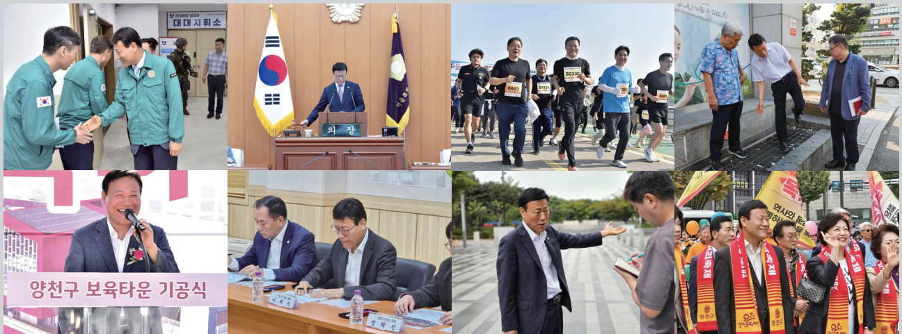
양천구 보육타운 기공식