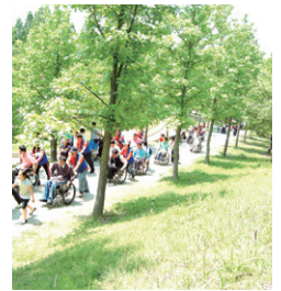
시민 건강 증진