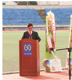
지역 발전 기여