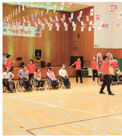
장애인 복지 활동