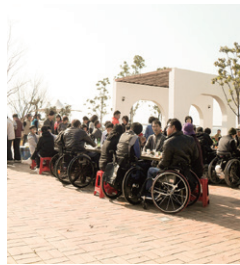
나눔과 봉사 실천