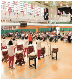
예술 · 문화 지원