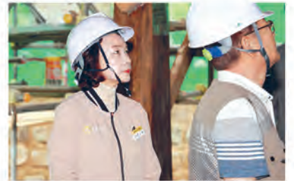
현장 안전 점검 ▲