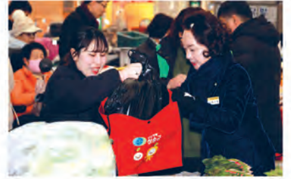
전통시장 장보기 ▲