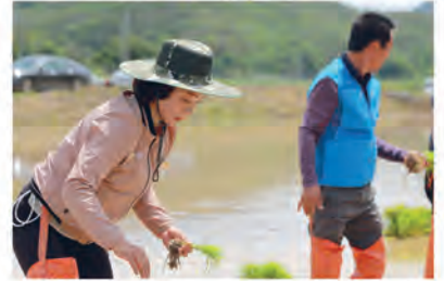
모내기 일손돕기 ▲