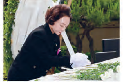
현충탑 참배 ▲