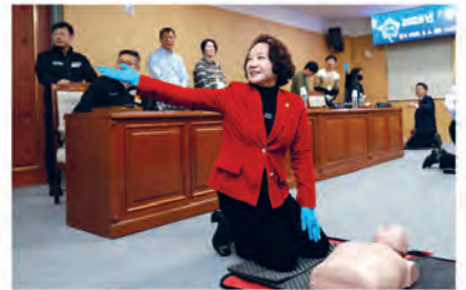
인명구조 실습 ▲