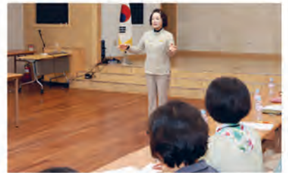
노인돌봄서비스 간담회 ▲