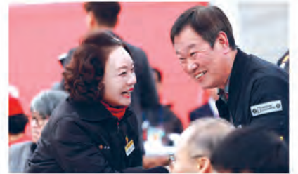
주민 소통 ▲