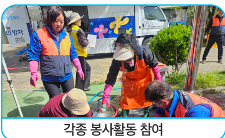
각종 봉사활동 참여