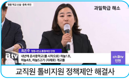
교직원 돌비지원 정책제안 해결사