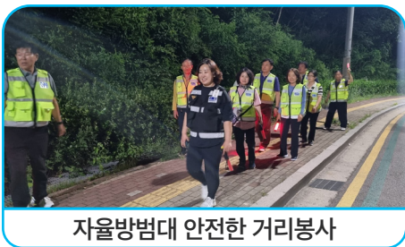
자율방범대 안전한 거리봉사