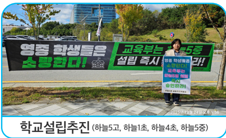
학교설립추진 (하늘5고, 하늘1초, 하늘4초, 하늘5중)