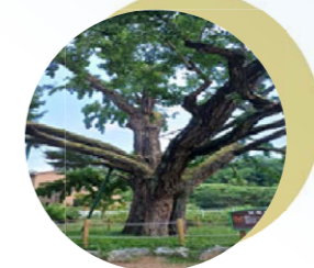
06 은행나무 보호수 정비 공원시설물 유지관리 일환으로 공원등 신규설치와 도시공원 환경정비 사업 실시