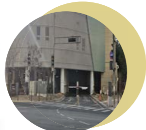
04 어진동 복컴 진출입로 개선 어진동 복합커뮤니티센터 기존 진입로 폐쇄 및 신규 진입로 설치