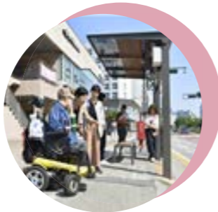
05 시내버스 정류장 이설 및 유지보수 도램마을 8,10단지 정류장 양방향 이설