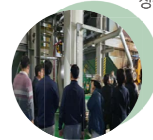
10 자동집하시설 탈취 설비 개선 및 증설 어진동 제3 자동집하시설 약취 방지용 활성탄 시설 보강