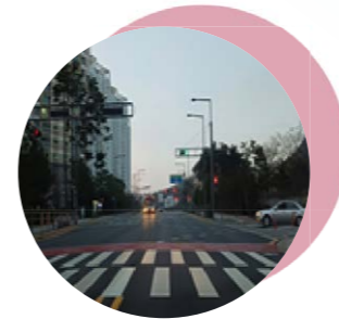
01 갈매로 저소음포장 어진동 도담동 갈매로 저소음 재포장공사