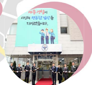
11 청사지구대 시설 도담동과 어진동, 나성동, 해밀동 관할