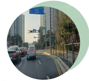
08 청사고차로 우회전 차로 신설 청사고차로 도램14단지 우회전 가감차로 확보