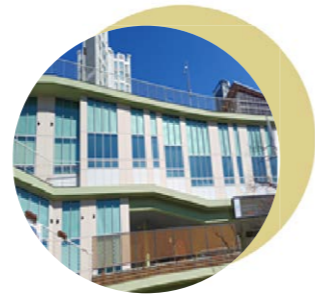
03 복컴 외벽 도색공사 도담동 복합커뮤니티센터 외벽 노후화에 따른 도색 공사