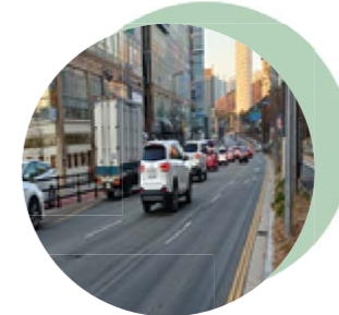
07 성금교차로 혼잡도 개선 상습 정체교차로 개선