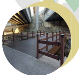
09 방축천 목교설치 어진동 방축천 자전거 및 유아차 횡단가능한 목교설치