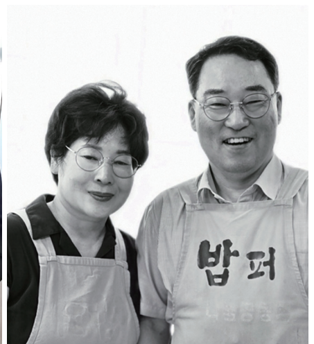
봉사시간 : 4,199시간