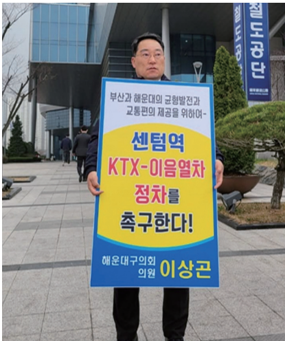
센터역 KTX-이음열차 정차 촉구