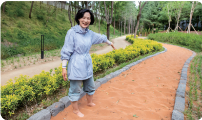
봉무동 맨발걷기 특별교부세 확보 4억 3천 예산 확보

하천 정비사업 추진 재해 예방 및 보행환경 개선 지역 기반시설 정비 확대