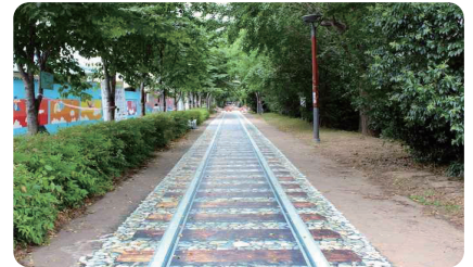
해안동 대구선 공원 정비 및 조명 설치 주민 안전 확보와 야간 보행환경 개선 추진