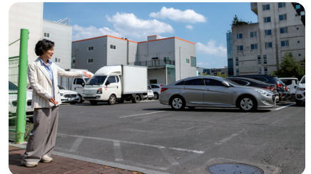
이시아폴리스 롯데몰 남쪽 공한지 주차장 백면 확보 주차난 해소와 주민·방문객 편의 증대 추진