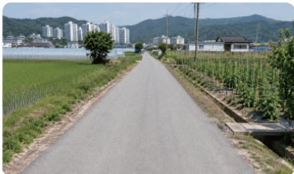
도평동 농로 포장 농업인 통행 불편 해소와 영농환경 개선