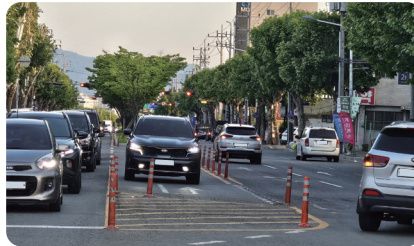
불로시장 앞 유턴자리 재조성 설치 차량 흐름 개선 및 교통사고 감소