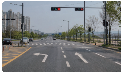
이시아폴리스 강변도로 차선 개선 안전하고 편리한 도로 환경 조성