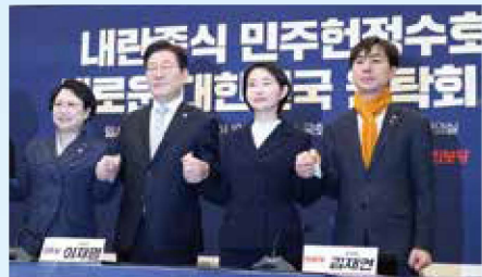
*내란종식 민주헌정수호 새로운 대한민국 원탁회의 출범식(25.2.19) 윤석열 탄핵 심판에 따른 조기 대선에서 국민의힘 재집권 저지를 위해 당시 5개 원내야당이 공동으로 출범