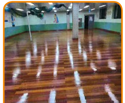
용지동 탁구장 노후바닥 공사