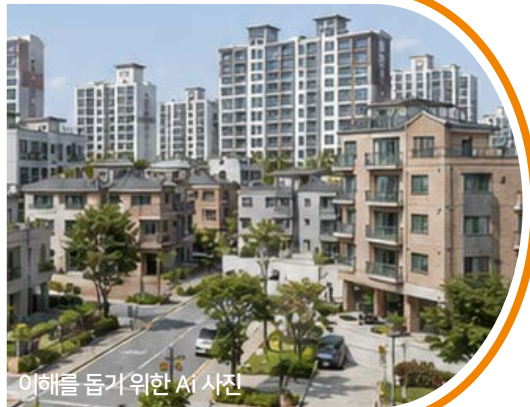
이해를 돕기 위한 시 사진