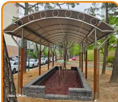
용지문화공원 맨발휴길 조성