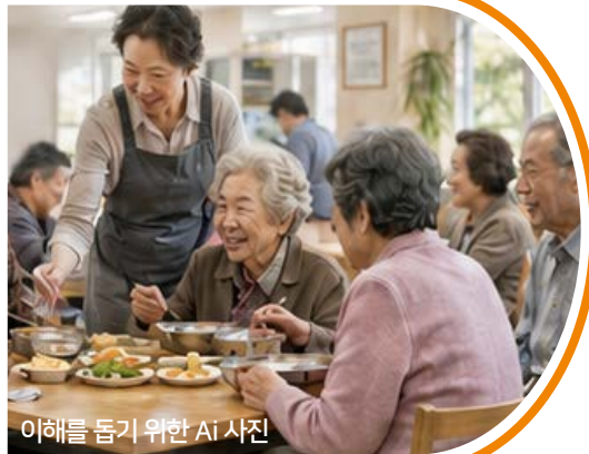
이해를 돕기 위한 시 사진