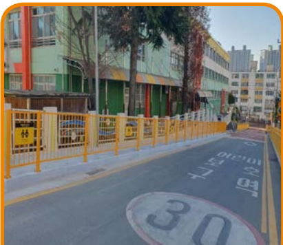
용남초 후문보행로 개선