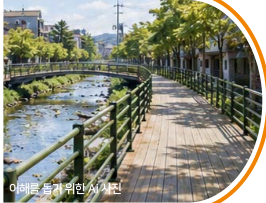
이해를 돕기 위한 시 사진