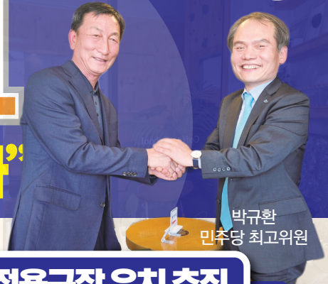
박규환 민주당 최고위원