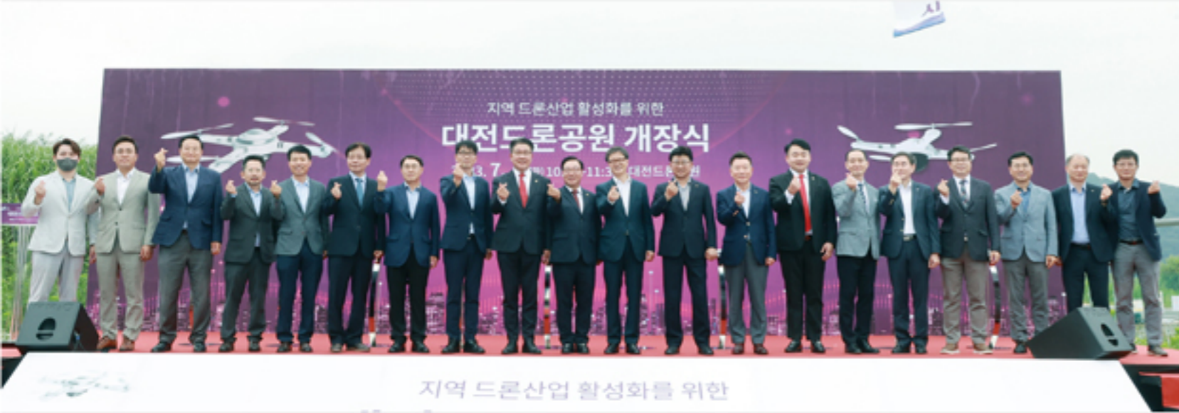
지역 드론산업 활성화를 위한