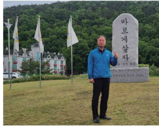
가평읍바르게살기 환경 정화