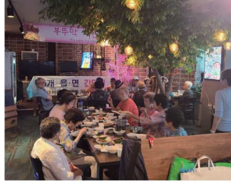
대곡2리 어르신 나눔 식사