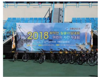
2018 화악산 힐클라임대회