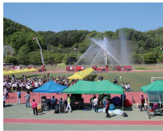
2012 어린이 세발자전거대회