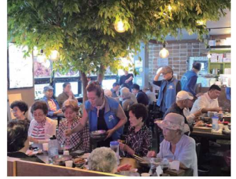
읍내3리 어르신 나눔 식사