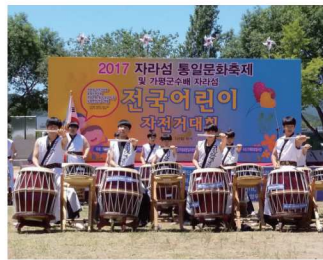
2017 전국 어린이자전거대회