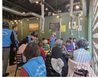
달전2리 어르신 나눔 식사