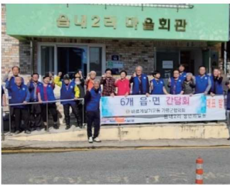
읍내2리 마을회관 청소