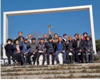
읍내4리 어르신 나들이