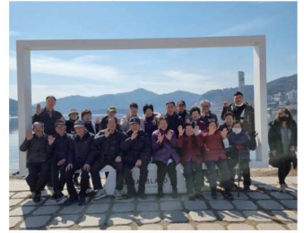
개곡2리 어르신 나들이