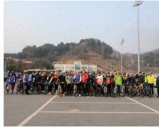
화악산 산신제 연합라이딩