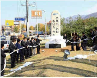
가평청년회의소 표지석 건립