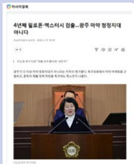
4년째 필로폰·엑스터시 검출... 광주 마약 청정지대 아니다