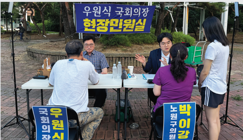
우원식 국회의장과 함께한 월계동 현장민원실

2022년 7월 부터 현재까지 매주 일요일 총 330여회 개최 2,800여건 접수 2,000여건 처리