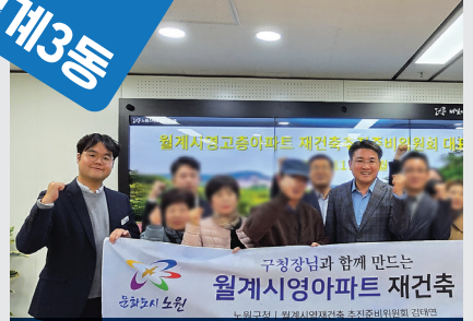
미미삼 재건축 신속추진 간담회