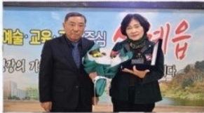
전북자치경찰위원회 '감사장' 전수