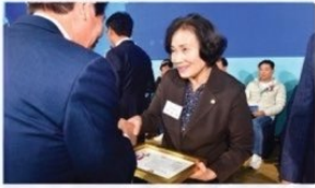
전북 시군의회 한마음대회에서 '지방의정봉사상' 수상