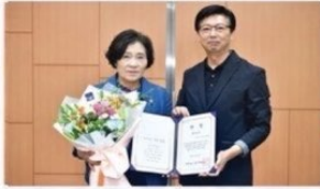
깨어있는 완주사람들 선정 '행감 최우수의원' 영예