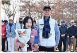
삼례금와파크골프협회로부터 공로를 인정받아 공로패 수상