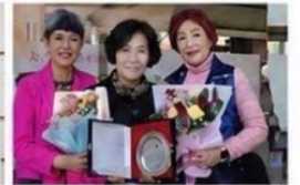
대한노인회 삼례읍분회 정기총회에서 공로패를 수여