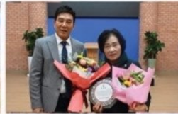
완주에버그린케어어로부터 공로를 인정받아 공로패 수상