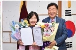
'삼례골목, 예술로 피어나다' 프로젝트에서 감사패 수상