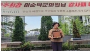
완주푸르지오 1,2마을 주민들에게 '감사패' 수상