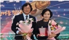
제 7회 향아축제에서 공로를 인정 받아 '감사패' 수상