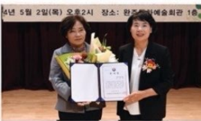
효사랑실천 전북협의회로 '감사패' 수상