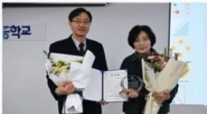
완주 수소에너지고등학교에서 공로를 인정받아 '감사패' 수여