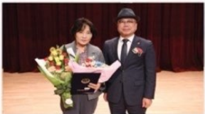
전북교육감배 피아노 콩쿠르로서 '감사장' 받아