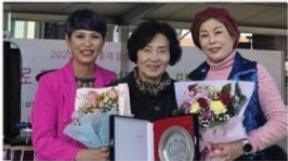
효도대상 및 어르신 위안행사에서 효사랑실천 전북협의회로부터 '감사패' 수상