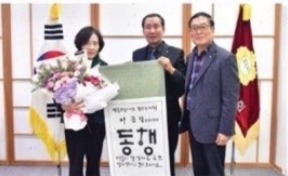
'(사)한국주민주자증양회 회장상' 수상