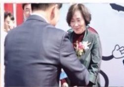
삼례 달기축제에서 삼례 달기위원회로부터 '감사패' 수여