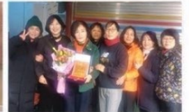
완주군 생활체조 삼례읍지회로부터 제도, 행정적공로 인정받아 공로패 수상