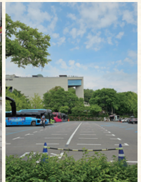
서대문 형무소 역사관 주차장