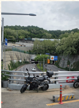
금화터널 봉원동 방향